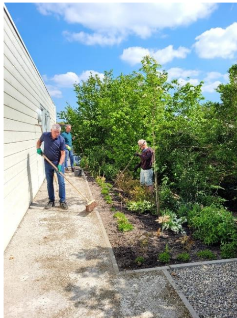
Tuinvrijwilligers doen het onderhoud

Op 10 oktober vierden we met de vrijwilligers AmandiDag: een dag in het teken van dankbaarheid voor de inzet van velen. Voor het eerst konden we met een grote groep bijeen zijn.