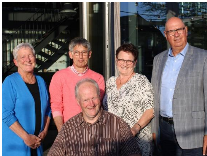
Het nieuwe bestuur

In het kader van de Uitvoeringswet Algemene verordening gegevensbescherming (AVG) zijn diverse reglementen binnen het AmandiHuis en het privacyreglement getoetst en op onderdelen aangepast.