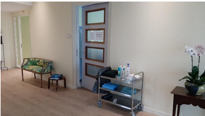
Extra maatregelen in Coronatijd

Net als in de hele samenleving, welke gebukt ging onder de covidpandemie, bepaalden de noodzakelijke maatregelen ook de dagelijkse gang van zaken in het huis. Om de zo belangrijke nabijheid in de laatste levensfase mogelijk te maken en tegelijkertijd het risico op besmetting zo klein mogelijk te houden, was vindingrijkheid en steeds opnieuw 'schakelen' nodig. Onze coördinatoren en vrijwilligers en de verpleegkundigen van Buurtzorg hebben hier een geweldige prestatie verricht.