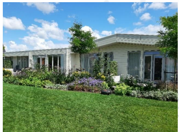
Gasten waarderen de tuin

Behalve de zorg voor de gasten hadden de vrijwilligers ook oog voor de naasten. De coördinatoren hebben ook altijd nog een contactmoment met de naasten van een overleden gast.